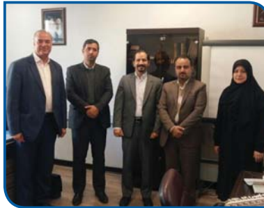
شاهد تنومند ترشدن نهال نوپای مرکز نوآوری و شتابدهی ترشیز هستیم

وی تصریح کرد: ما آماده ارائه خدمات مشاوره ای و معرفی فعالیتهای حمایت از صاحبان ایده های برتر هستیم تا با هم افزایی بیشتر طرح های نوآورانه و ایده های خلاق خوب پیش برود و به مرحله تجاری سازی هم برسد.