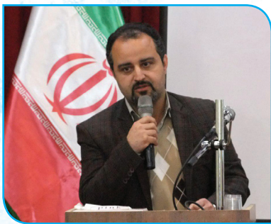
برنامه راهبردی مرکز آموزش عالی کاشمر، رفتن به سمت دانشگاه کارآفرین است.

آموزش عالی کاشمر نیز در سخنانی با تبریک پذیرش دانشجویان ورودی جدید بر رعایت نکات آموزشی و انضباطی از سوی آنان تاکید و ابراز امیدواری نمود؛ با حمایت های دانشگاه و همکاری دانشجویان بتوان برای توسعه و تعالی دانشگاه و ارتقا دانشجویان برنامه ریزی کرد.